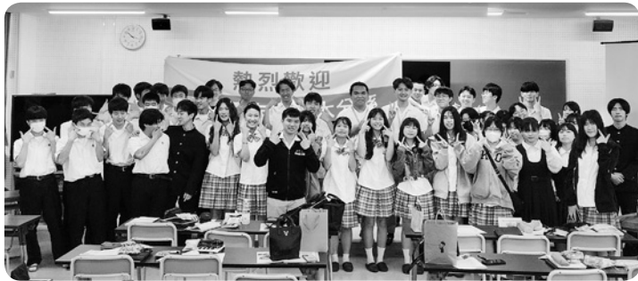
台湾生徒との交流

さや元気の良さを発揮していました。令和9年に控える創立130周年に向けて、少数精鋭で頑張ってくれるものと期待しています。 5月には台湾の国立北港高級中学の生徒15名を本校にお迎えして交流会が開催され、歓迎行事に続いて本校生徒と一緒に授業を体験したり、茶道や書道にも挑戦してもらいました。本校生徒は想像以上にホスピタリ