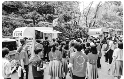
臥牛祭・文化の部(キッチンカー)

られ、初めてキッチンカーを招いたり、体育館の音響や照明を外部の業者に委託するなど、校訓の「自律自尊」「進取研鑽」の精神を遺憾なく発揮してくれました。